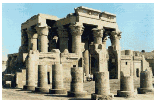
Tempio di Sobek

Dopo la prima colazione visita del tempio di Edfu. In origine la città, il cui nome era Behedet, fu capitale del secondo distretto, Terra di Horo, dell'Alto Egitto. In epoca posteriore fu conosciuta con il nome greco di Apollinopolis Magna.