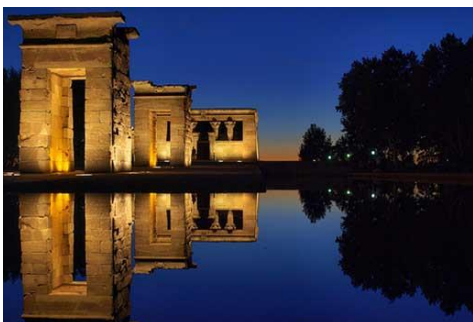
Tempio di Luxor

6° giorno 30 marzo 2015, lunedì: IL CAIRO ✈ LUXOR (sabato)