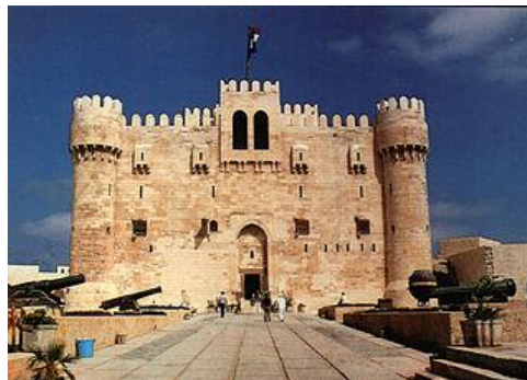
Forte di Qaibay

Prima colazione, rilascio della camera ed intera giornata dedicata alla visita del forte di Qaibay , la catacombe di Korn El Shogafa, la colonna di Pompeo, il serapeum e l'anfiteatro Romano. Pranzo in ristorante e proseguo del viaggio sino a il Cairo. Cena in ristorante e rientro in hotel per la notte.