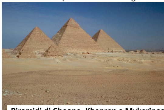
Piramidi di Cheope, Khepren e Mykerinos

Mykerinos, secondo i nomi tramandati dalla tradizione greca ed ellenistica, tutte appartenenti a sovrani inseriti nella