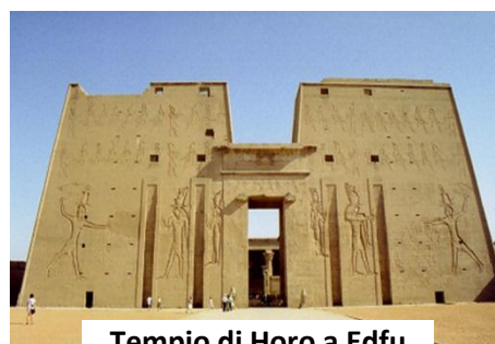
Tempio di Horo a Edfu

La notorietà di Edfu è dovuta al tempio, dedicato al dio Horo, tolemaico, costruito fra il 237 a.C. e il 57 a.C., uno dei templi meglio conservati in tutto l'Egitto. Il tempio di Edfu, pur essendo stato costruito in epoca greco-romana, è aderente ai canoni classici dell'architettura egizia. Rientro e navigazione verso Kom Ombo. Pranzo a bordo. Kom Ombo è una città dell'Egitto posta sulla riva occidentale del Nilo. Si trova a circa 40 Km a nord di Aswan. Notevoli i resti archeologici. In particolare è da