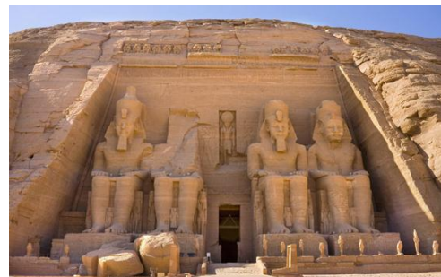
Tempio di Abu Simbel

Dopo la prima colazione visita della Diga Alta, proseguimento con le cave di granito che conservano ancora oggi un obelisco incompiuto, dello splendido tempio di Philae e di Abu Simbel (con bus). Pranzo e cena inclusi. Pernottamento ad Aswan.